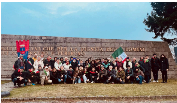
28° Viaggio della Memoria, Marzo 2026